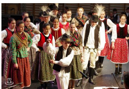
A Gencsapáti Hagyományörző Néptáncgyűttes 2015. évi szakmai munkájának rövid bemutatása

2. Művészeti csoportjaink a szakmai munkánk alapját jelentik, hiszen a közművelődési terület egyik legfontosabb feladata a művészeti közösségek létrehozása, gondozása. Az előző évben megvalósított programjaikról, eredményeikről készítettünk egy rövid beszámolót.